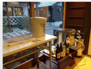
日原商工業振興会 新年会